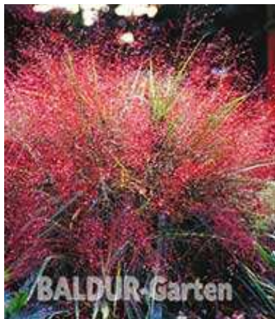
Rotes Liebesgras Art.-Nr. 2036

Standort/Pflege: Bei der Wahl des Standortes sollte ein sonniger Platz bevorzugt werden. Auch im Halbschatten gedeihen die Pflanzen noch. Der Boden sollte humos, feucht und durchlässig sein . Auch wenn Ziergräser dort am allerbesten wachsen, gedeihen sie praktisch überall. Es sind pflegeleichte Pflanzen , an denen auch Hobbygärtner mit weniger Zeit lange ihre Freude haben. Es müssen nur grundsätzlich ein paar Dinge beachtet werden: Im Frühjahr sollte ein Rückschnitt auf zehn Zentimeter Höhe erfolgen (Auf keinen Fall darf der Rückschnitt im Herbst erfolgen, da dieser die Pflanze schädigen würde). Dadurch treibt das Gras wieder frisch aus und erreicht im Sommer seine gewohnte Höhe. Über Winter sollte es dann in seiner vollen Höhe stehen gelassen werden. So kann kein Wasser in die hohlen Halme eindringen und zu Fäulnis führen. Einzig im ersten Winter nach der Pflanzung empfiehlt sich ein Winterschutz mit einer dicken Schicht Laub oder Tannenreisig.