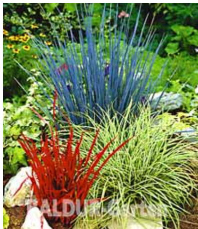
Ziergras-Mischung Art.-Nr. 1507